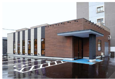
(仮称) 清水2丁目脳神経クリニック