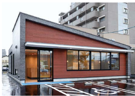
(仮称) 清水2丁目皮膚科クリニック